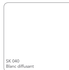
SK 040 Blanc diffusant

Si vous ne trouvez pas ce que vous recherchez ou si vous voulez demander un échantillon, appelez-nous au: